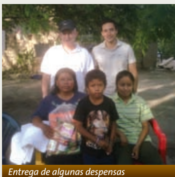
Entrega de algunas despensas