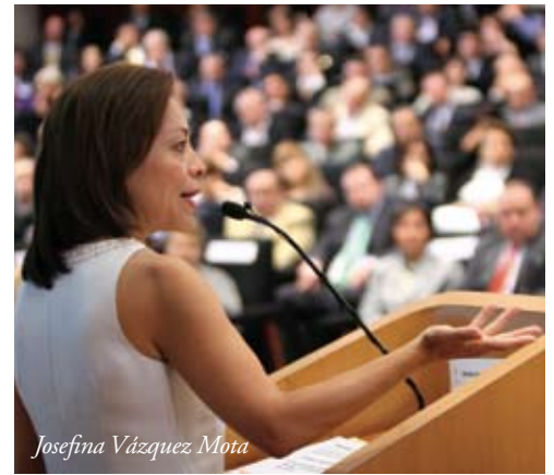
Josefina Vázquez Mota