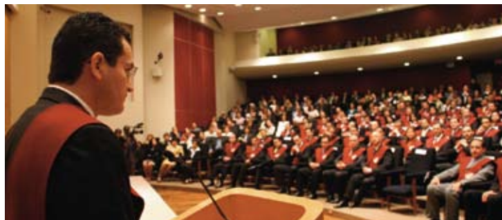
Ceremonia de graduación en el Aula Panamericana, sede México.

“El reto del director de empresa es actuar con amor y esperan-